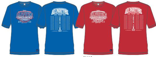
【WHT】プリント(前胸):ROY×ORG プリント(背面):ORG 【NAVY】プリント(前胸):KEY×WHT プリント(背面):WHT 【BLK】プリント(前胸):MNT×WHT プリント(背面):WHT 【ROY】プリント(前胸):RED×WHT プリント(背面):WHT 【RED】プリント(前胸):GRY×WHT プリント(背面):WHT