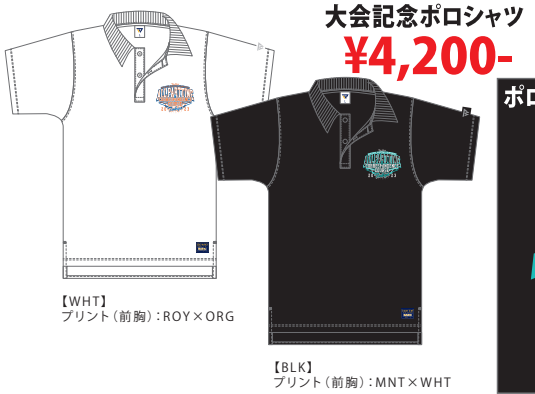
【WHT】プリント(前胸):ROY×ORG 【BLK】プリント(前胸):MNT×WHT