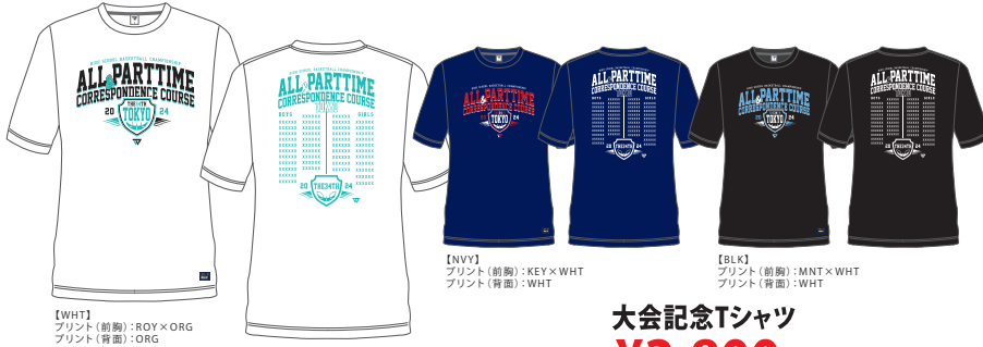
[WHT] プリント(前胸):ROY×ORG プリント(背胸):ORG